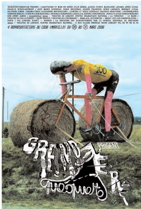
Affiche du spectacle conçue par M/M (Paris) pour le CDDB Théâtre de Lorient

Contact diffusion : 06 07 25 92 66 patrice.rabine@follepensee.com Théâtre de Folle Pensée BP 4315 - 22043 Saint-Brieuc cedex 2 Licence n° 2-220398